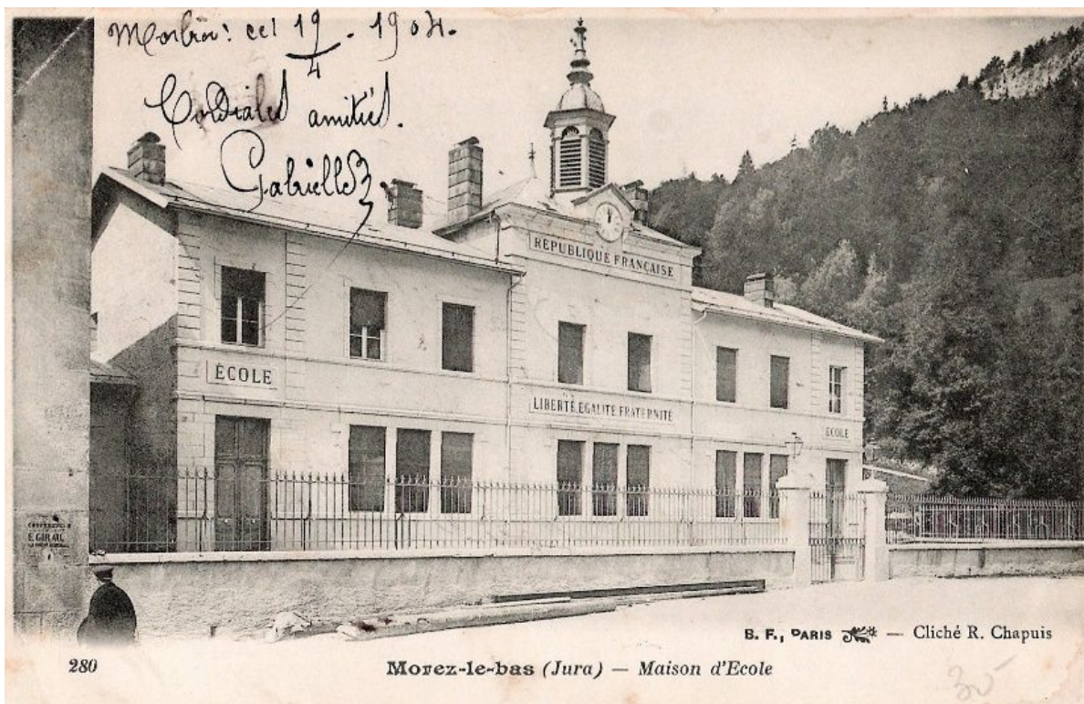
L'école de Morez-le-bas en 1904.