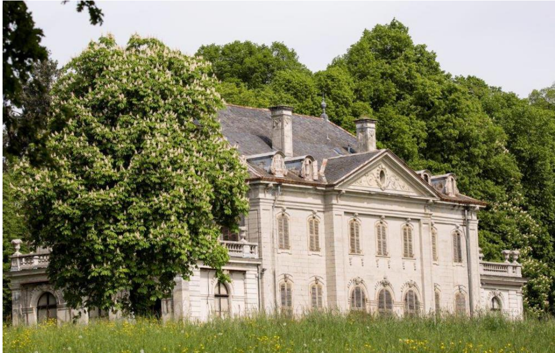
Château du grand Malagny