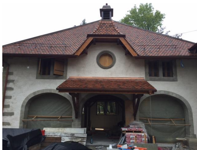
L'horloge Francis Paget va pouvoir retrouver sa place initiale. Noter l'ouverture ronde prévue pour le cadran et le clocheton.

A cette époque, l'ensemble de la vie du domaine était rythmé par les cloches d'une horloge d'édifice Francis Paget dont nous parlerons plus loin.