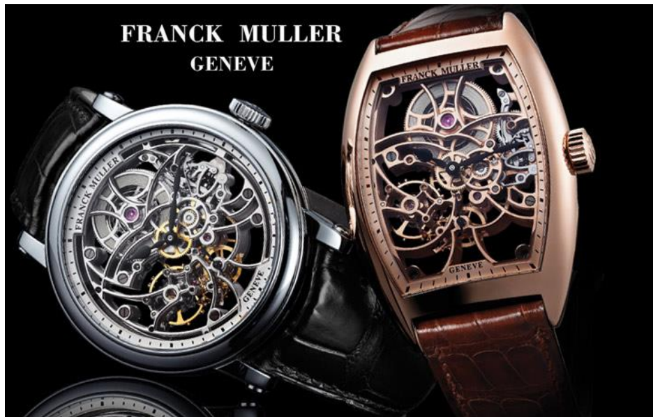
Franck Muller - Genève.